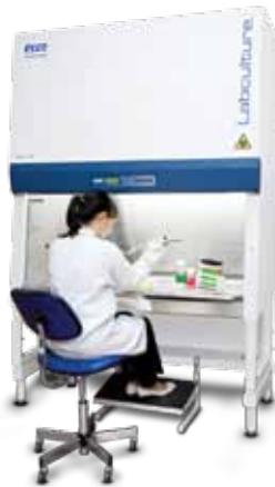
Image 1. PSM de Classe II Type A2

Avec la nouvelle norme NSF/ANSI 49:2010, les postes de Classe II de Type A1 et A2 doivent avoir leur plenum contaminé à pression positive entouré par une pression négative. Dans le cas d'une fuite du plenum positif, la fuite d'aérosol sera ramenée vers le plenum à pression positive par la pression négative, empêchant ainsi toute fuite vers l'extérieur. Dans les postes de Type A2, environ 70% de l'air présent de le plenum positif est renvoyé vers l'intérieur en flux descendant, et les 30% restant sont évacués vers le laboratoire via un filtre dédié à l'évacuation.