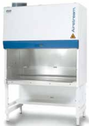
Image 2. PSM de Classe II Type B2

Dans le poste de Classe II Type B2 à la fois les flux entrants et descendants sont évacués après une filtration HEPA vers l'environnement extérieur sans recirculation dans le poste. Les postes de Type B2 sont adaptés pour un travail avec des agents chimiques toxiques employés comme complément lors des manipulations microbiologiques sous n'importe quelles conditions vu qu'aucun flux d'air n'est recirculé. En théorie, les postes de Type B2 peuvent être considérés comme les postes de sécurité microbiologique de Classe II les plus sûrs car toutes les possibilités d'extraction se bloquent lorsque les systèmes de filtration HEPA du flux d'air descendant / ou d'évacuation rencontrent