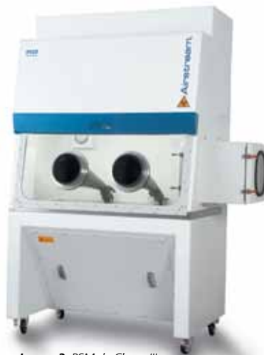
Image 3. PSM de Classe III